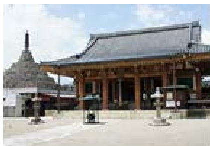
壬生寺 本堂・狂言堂