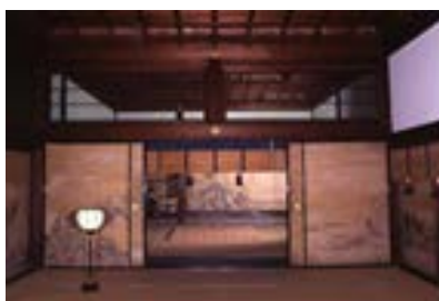
知恩院 大方丈・小方丈・方丈庭園