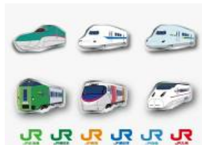
ピンバッジセット(イメージ)

モバイルラリー告知B1ポスターをJR各社の主な駅で掲出いたします。掲出時期は2011年7月28日(木)以降を予定しております。