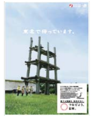
イメージ(三内丸山遺跡)